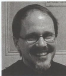
François en collant des capteurs filmés par

L'archet de François Rabbath, peu tendu, bien perpendiculaire, prône un son simple, sain, (qu'il appelle le son premier), la main souple, le poids du bras décontracté, l'épaule active. Les autres sons obtenus en variant les multiples paramètres font ensuite varier la palette sonore. Les différents modes d'attaque sont expliqués clairement et mécaniquement.